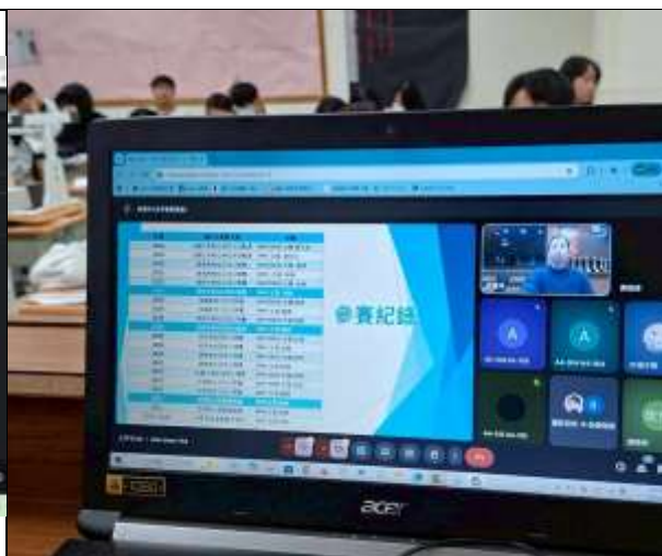
教師線上參與講座