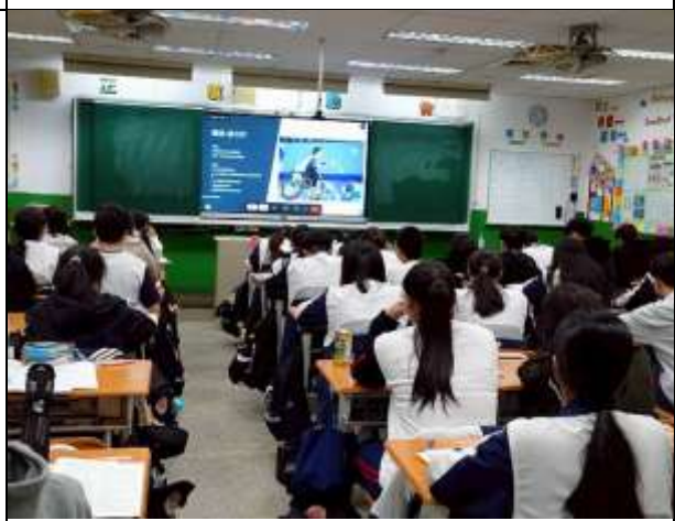
各班參與演講活動照片