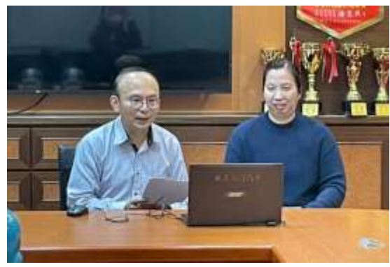
本校校長參加生命鬥士演講活動，擔任引言人 致謝講師分享其生命故事外，以鼓勵全校學 生，正向思考創造積極人生