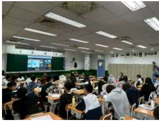
各班參與演講活動照片