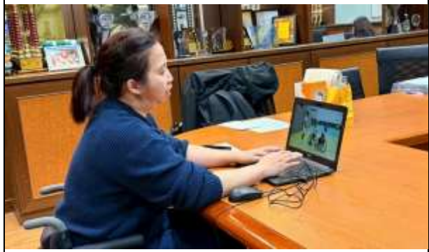
講師分享生命歷程