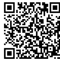
酷課 App 問卷填答 操作步驟說明