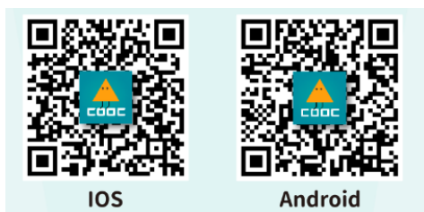
酷課 App 下載

關於親子綁定及問卷填答操作之步驟，可掃描下列 QR code 後，即可開啟詳細說明