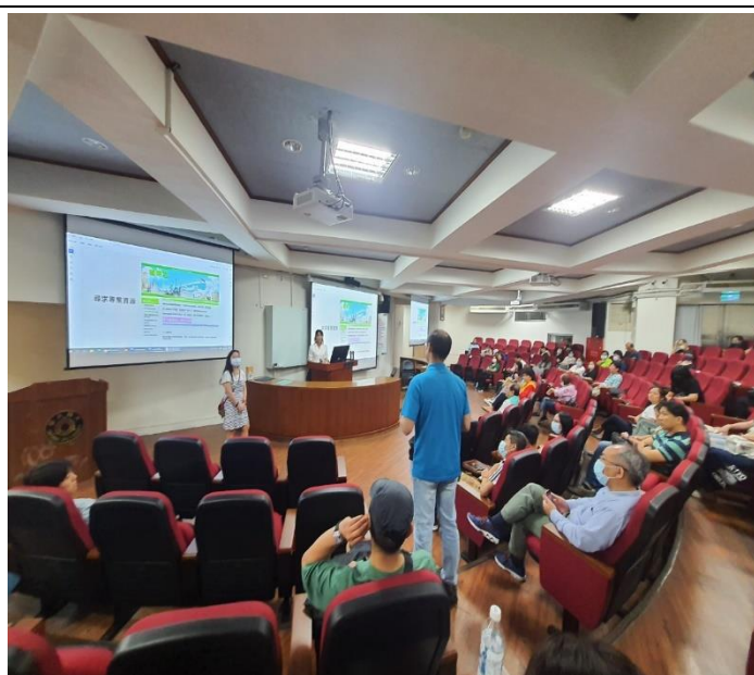
綜合座談-家長與講師討論