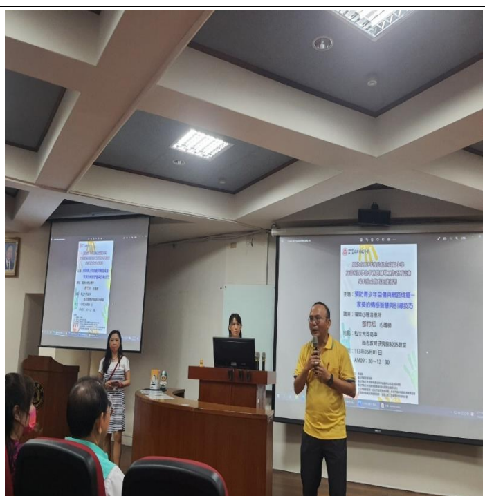
臺北市私立大同高中辦理家長生命教育 研習-校長引言介紹師資