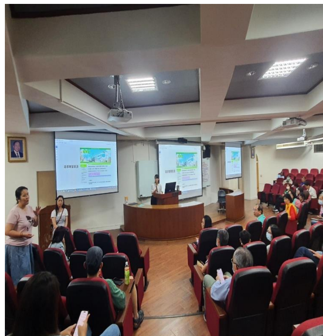
研習主題『預防青少年自傷與網路成癮， 家長的情感智慧與引導技巧』