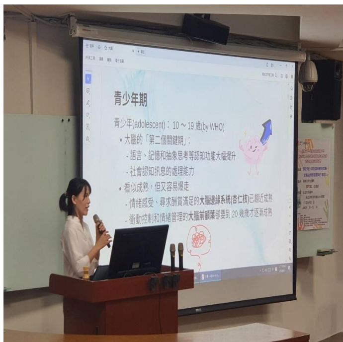
講師案例分享，與家長、老師討論